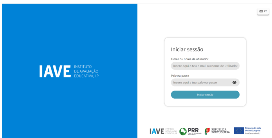
Figura 1 – Acesso à Plataforma de Realização de Provas do IAVE

(Obs.: Para as escolas que optaram pelo offline em rede ou standalone, os procedimentos para acederem à Plataforma de Realização de Provas do EduQA são os constantes no Manual Offline, publicado na Área Escolas do JNE);